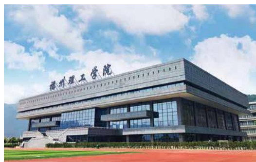
福州理工学院图书馆

“讲师+工程师+技术股东”的深度产教融合模式，打通“产品”与产业结合的最后一公里