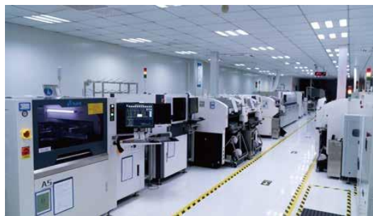
数字福建车联网实验室芯片模组生产线

把高端制造引进校园，实施“R&D+M”的应用技术大学科研创新模式，打通科研成果转化为产品的最后一公里