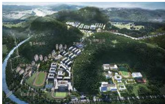
福州理工学院三创产业园

把信息与科技型企业引进校园，打造开放型的“三创产教融合科技园”，打通学生培养模式的最后一公里