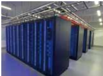
大数据分析计算中心

云计算重点实验室是福州理工学院在信息通信技术 (ICT) 领域的教学与科研平台。该重点实验室由通信网络技术实验室、5G+图像处理实验室、大数据分析计算中心、网络安全实验室、软件测试实验室等 5 个实验室组成，为福州理工学院“立足信息与科技产业，为区域经济服务”的定位以及新工科研究与改革实践提供强有力的技术支持